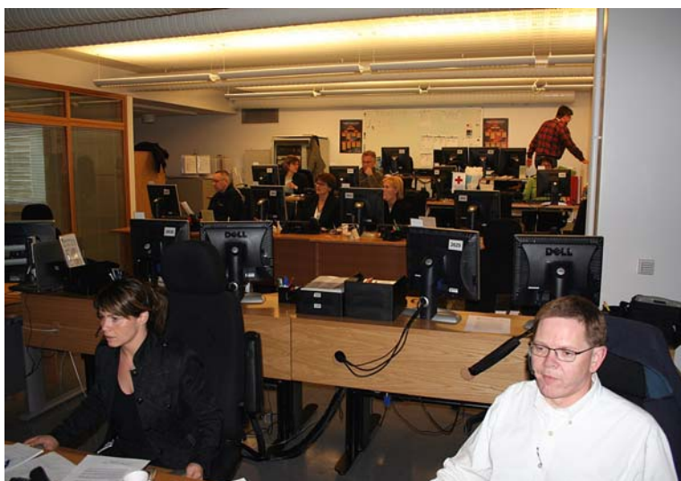
Frá æfingu á viðbrögðum við heimsfaraldri influensu í Samhæfingarstöð almannavarna í Skógarhlíð í nóvember sl.

Á þessu hausti fóru fram á vegum Evrópusambandsins æfingar á viðbrögðum við bólusóttarfaraldri annars vegar og heimsfaraldri influensu hins vegar. Æfingarnar, sem stóðu í tvo daga hvor, fóru fram í október og nóvember síðastliðnum. Fyrri æfingin var eins konar undirbúningur fyrir þá síðarnefndu, en þá var sviðsettur heimsfaraldur influensu. Þátt tóku allar 25 aðildarþjóðir Evrópusambandsins og Ísland, Noregur og Sviss, Framkvæmdastjórn Evrópu, Sóttvarnastofnun Evrópu, Lyfjastofnun Evrópu, lyfjafyrirtæki og bóluefnisframleiðendur.