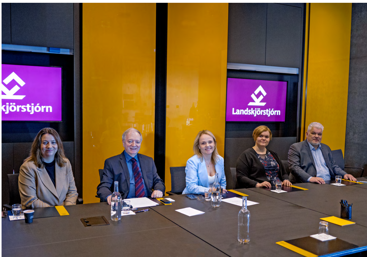
Landskjörstjórn í Hörpu við móttöku framboða.