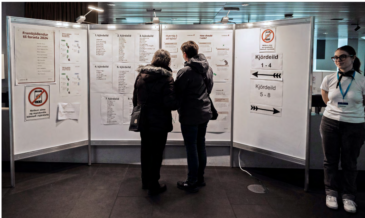
Kjósendur á kjörstað.