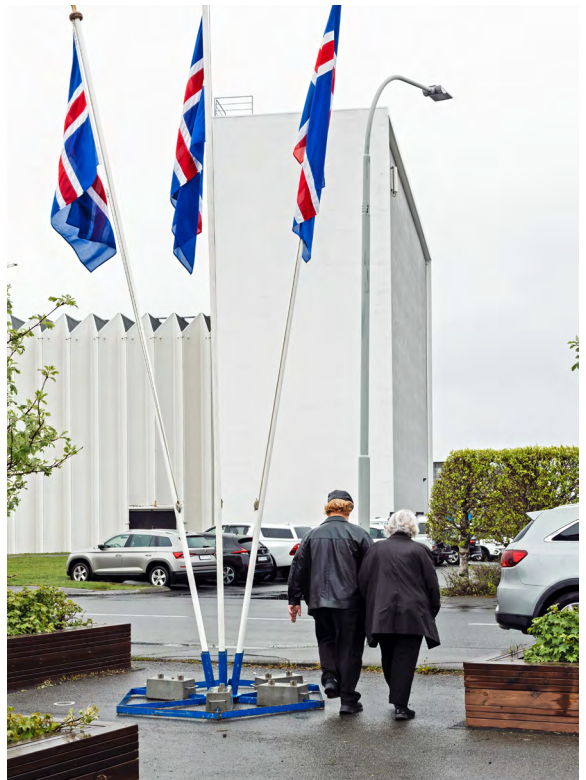
Kjósendur ganga af kjörstað.

Landskjörstjórn útbjó leiðbeiningahefti fyrir umboðsmenn , yfirkjörstjórnir kjördæma , yfirkjörstjórnir sveitarfélaga og kjörstjóra og einnig hefti um talningu atkvæða . Þá útbjó landskjörstjórn sniðmát að fundarreglum fyrir yfirkjörstjórnir kjördæma.