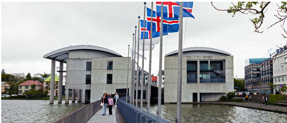
Fánaborg við Ráðhús Reykjavíkur.