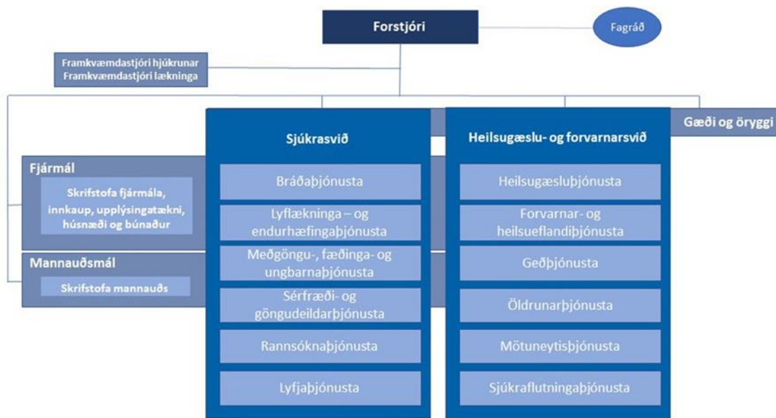
Mynd 2. Skipuritið sýnir hvaða starfseiningar tilheyra hverju sviði Heilbrigðisstofnunar Suðurlands