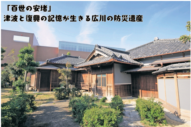
「百世の安堵」 津波と復興の記憶が生きる広川の防災遺産