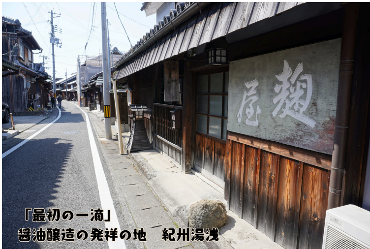
「最初の一滴」 醤油醸造の発祥の地 紀州湯浅