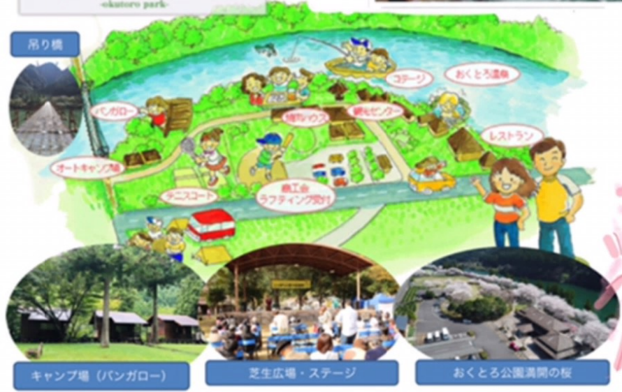
キャンプ場 (バンガロー)