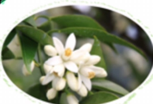
じゃばらの花 はな