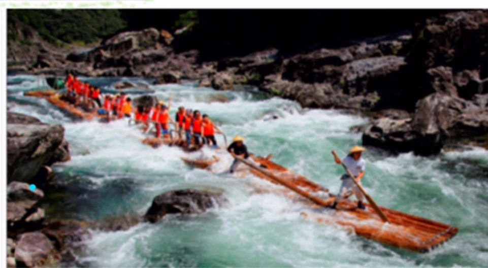
おくとろ公園 -okutoro park-