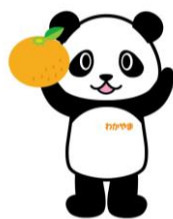
（グリップ：オレンジ）