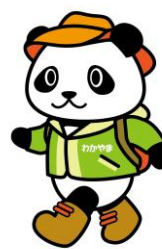
（グリップ：アップルグリーン）