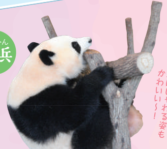
木に じゃれる姿も かわい い!