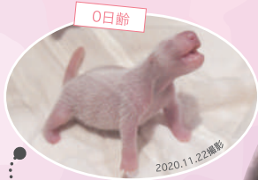
0日齢 よく動く元気な赤ちゃん!