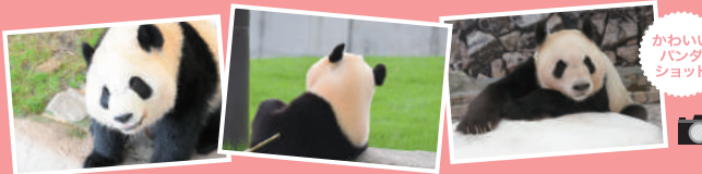
かわい いパンダ ショット