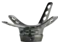
4WR95=1 ラミネーションアンカー 防水