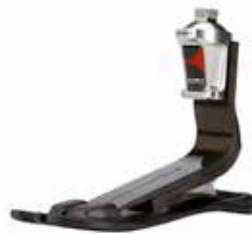
1C64 トリトン HD 防水 1C63 トリトン LP 防水