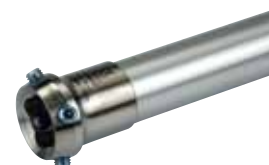
2R37 チューブアダプター防水 30mm (同梱)

前足部がしっかりしたトリトンファミリーをお勧めします。 遊脚相への切替わりがよりスムーズになります。