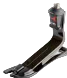
1C60 トリトン 1C63 トリトン LP 防水