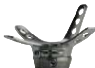
4WR95=1 ラミネーションアンカー 防水