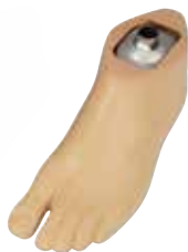
1D35 ダイナミックモーション

前足部がしっかりしたトリトンファミリーをお勧めします。 遊脚相への切替わりがよりスムーズになります。