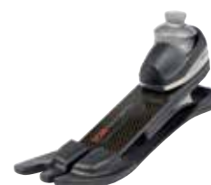
1C68 トリトン サイドフレックス 防水