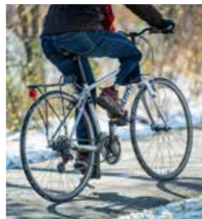
サイクリングモード