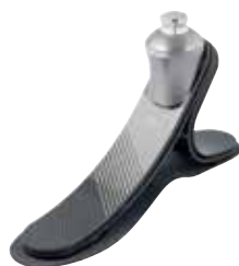
1C30 トライアス 防水