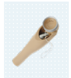
● 筋電用肘継手(成人)