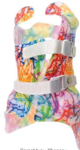
Gorset typu Cheneau