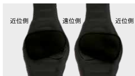
【左腕の場合】 【右腕の場合】