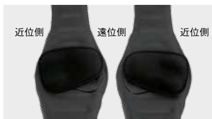
【左腕の場合】 【右腕の場合】