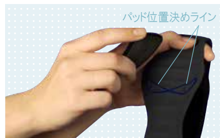
パッド位置決めライン