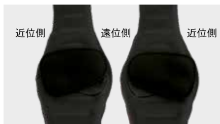
【左腕の場合】 【右腕の場合】