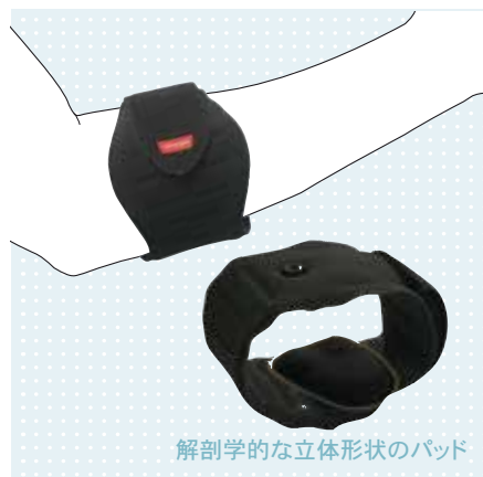
解剖学的な立体形状のパッド