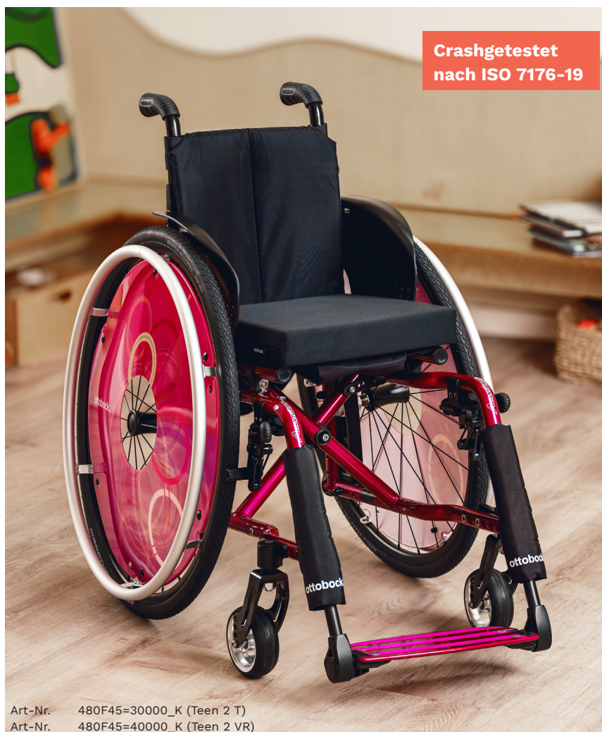
Art-Nr. 480F45=30000_K (Teen 2 T) Art-Nr. 480F45=40000_K (Teen 2 VR)