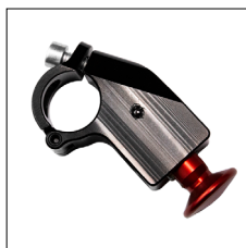
Universal-Klemmring für Tetra Griff