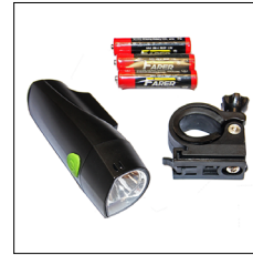
LED Fahrrad-Vorderlicht, weiss