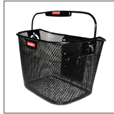
Korb 10 l oder 16 l