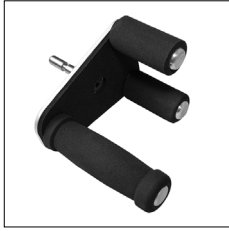
Tetra Gabel, 3-fach