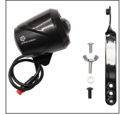
LED Fahrrad-Vorderlicht, integriert, weiss