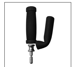
Tetra Gabel, 2-fach