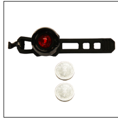
LED Rücklicht, rot