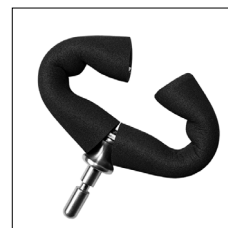
Tetra Griff, horizontal