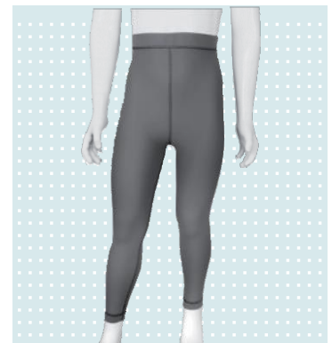
MyActive Leggings 654K2