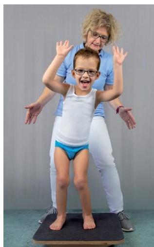
Nefyziologické držanie tela bez MyActive

Finálny produkt sa vyrába individuálne a presne pre konkrétneho užívateľa na základe 21 získaných mier v prípade MyActive Top, respektive 34 mier u MyActive Leggings.