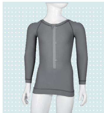
MyActive Top 654K1