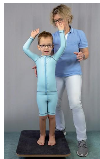
Zlepšené držanie tela s MyActive