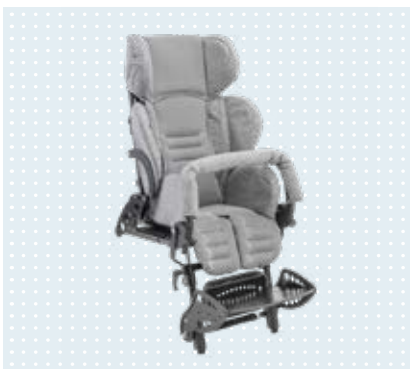
• Kimba Sitzeinheit