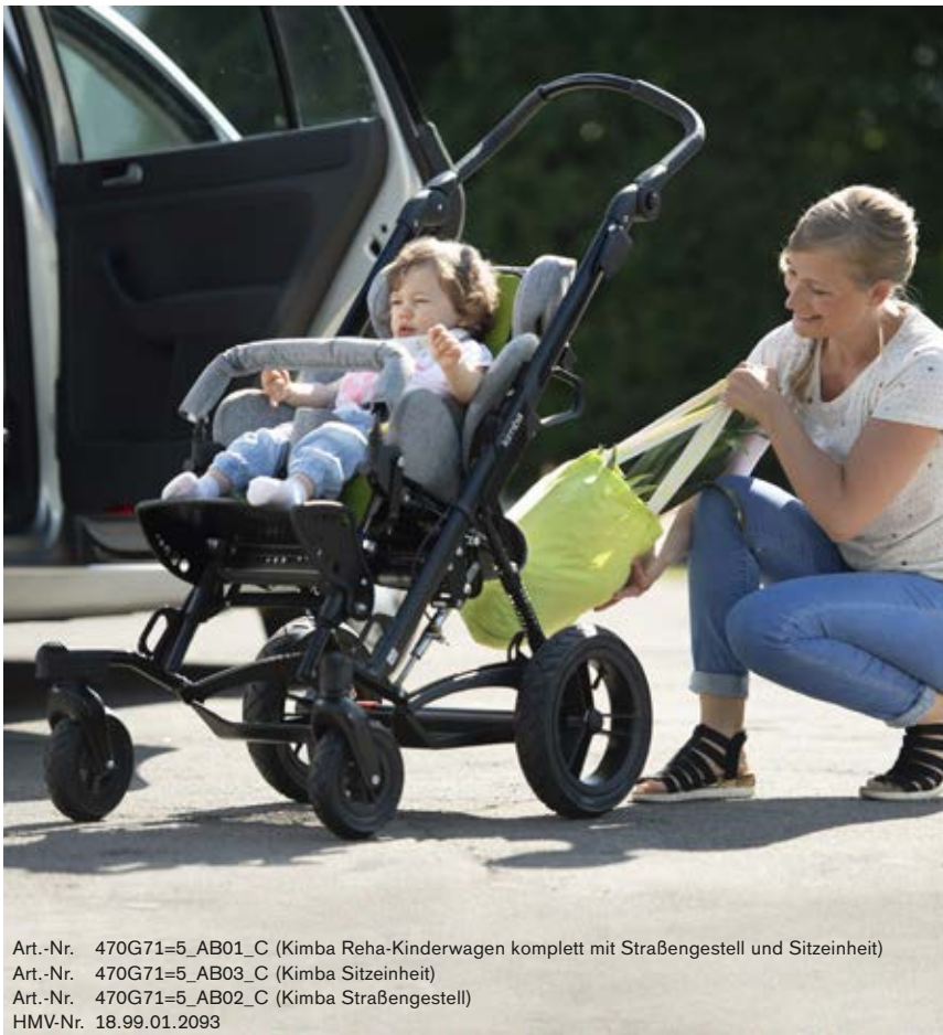
Art.-Nr. 470G71=5_AB01_C (Kimba Reha-Kinderwagen komplett mit Straßengestell und Sitzeinheit) Art.-Nr. 470G71=5_AB03_C (Kimba Sitzeinheit) Art.-Nr. 470G71=5_AB02_C (Kimba Straßengestell) HMV-Nr. 18.99.01.2093

Gemeinsam mit Anwendern, Therapeuten und Ärzten wurde der Kimba weiterentwickelt und optimiert. Im Fokus standen Sicherheit, Qualität, Individualität und Komfort. Der neue Kimba überzeugt mit einem luftigen Design, zusätzlichen Stauraum und diversen Optimierungen im täglichen Handling. Er bleibt der ideale Begleiter auf dem Weg zum Kindergarten, zum Supermarkt oder unterwegs im Auto.