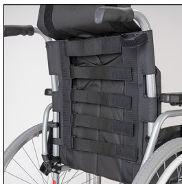
Toile de dossier Economy Ergo