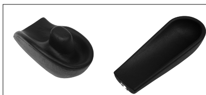
Positionnement des bras et des mains