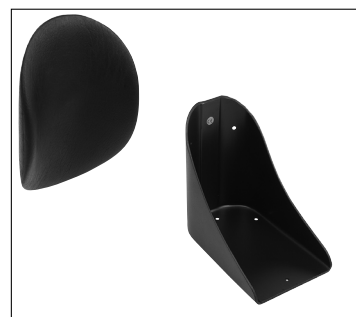
Positionnement des jambes et des pieds

Remarque : Vous trouverez d'autres accessoires tels que les appuis-tête, les supports thoraciques, etc. dans notre catalogue " Accessoires pour fauteuils roulants ".