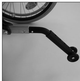
MA 103 Anti-bascule enfichable