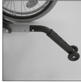
MA 103 Anti-bascule enfichable