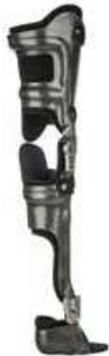
ユニラテラル アンクルジョイント (17LA3N p.59掲載)との使用組合わせ例

片側支柱で製作することを目的として開発された固定膝継手です。片側支柱にすることで、片手でロックを解除することができます。