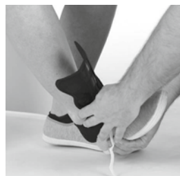
① 靴に装具を挿入してから足を靴に入れます。