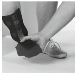
① 装具を足部に合わせます。