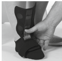
② 遠位ストラップを留めます。