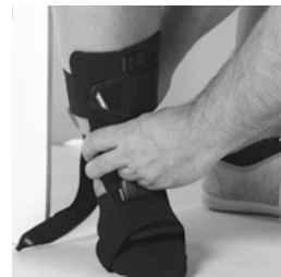
④ 下腿部のストラップを留めます。