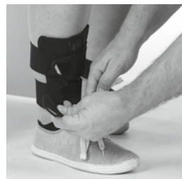
③ 下腿部の2本のストラップを留めます。