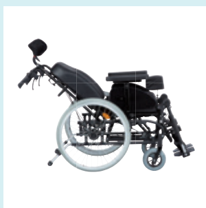
Regulacja kąta oparcia Regulacja kąta oparcia od 92 do 128 stopni.