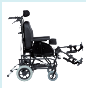
Regulowane podnóżki Pięć pozycji przy podnoszeniu podnóżków.