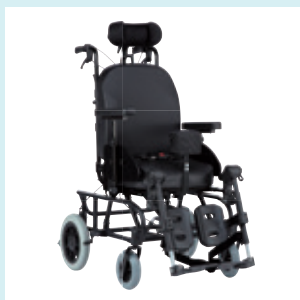
Podłokietniki z regulacją wysokości Łatwa w obsłudze regulacja wysokości podłokietników.