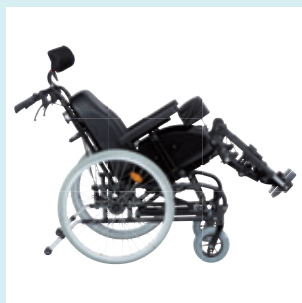
Regulacja kąta siedziska Regulacja kąta siedziska od 5 do 30 stopni.