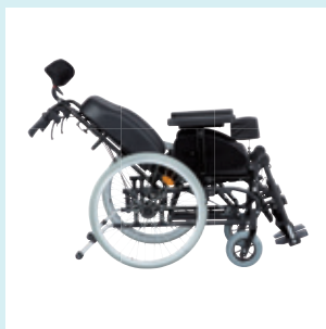
Regulacja kąta oparcia Regulacja kąta oparcia od 92 do 128 stopni.