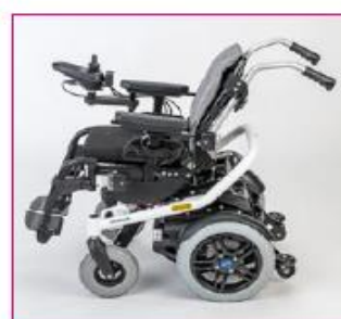
ED 50 Electric bank angle adjustment