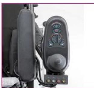
EU 20 Control panel holder, swing-away in parallel