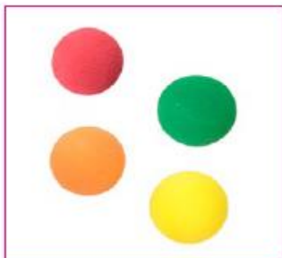
EU 35 Soft ball, coloured