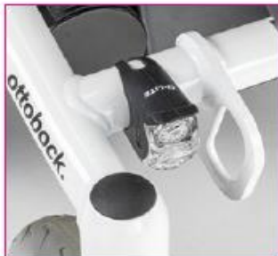
EU 08 Lighting for footpaths