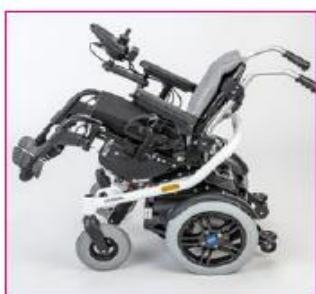
EC 50 Electric seat tilt