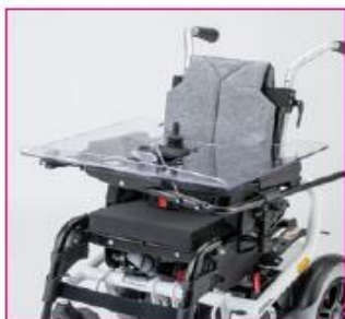
EU 06 Mid-tray control