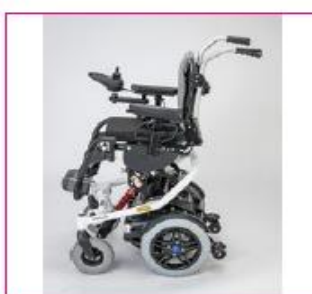
EC 57 Electric seat height adjustment