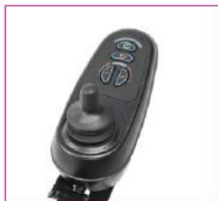
EU 85 Control panel, Standard