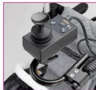
EU 15 Attendant control