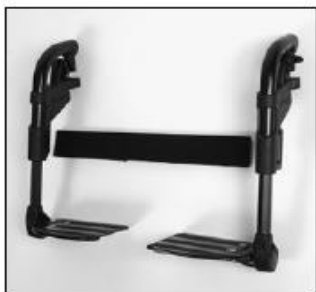
EB 02 Leg support, individual