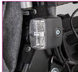
ES 06 Four way lighting, at the back

Firma Otto Bock Polska zastrzega sobie możliwość dokonywania zmian w konfiguracji zamówienia w pełnym porozumieniu z zamawiającym na wypadek niemożności dostarczenia pierwotnej wersji konfiguracji.