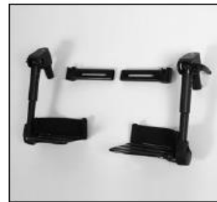
EB 20 Leg support, elevating