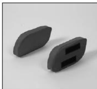
EE 37 Lateral pads