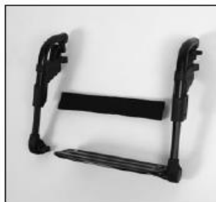
EB 05 Leg support, single-panel