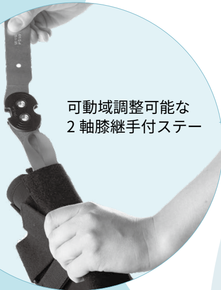
可動域調整可能な 2軸膝継手付ステー