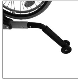
MA 103 Kippschutz steckbar