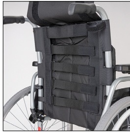
Rückenbespannung Economy Ergo