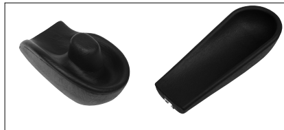
Arm- und Handpositionierung