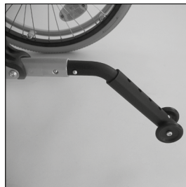
MA 103 Kippschutz steckbar