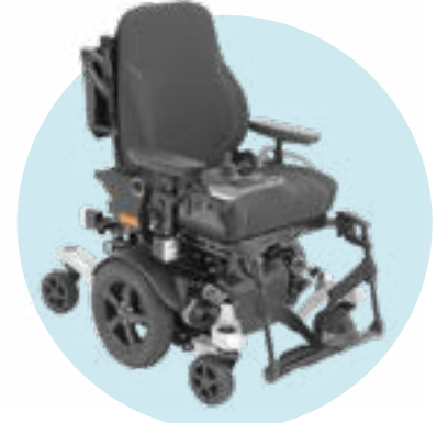
Abbildung zeigt Aufpreispositionen