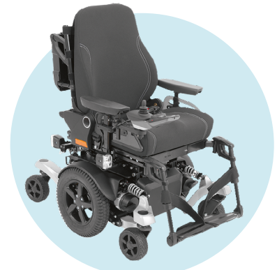
Abbildung zeigt Aufpreispositionen