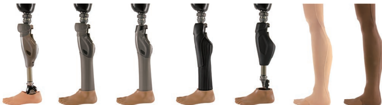
4P112=1 ファンクショナル ニーパーツ