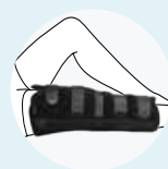
ゲニュー インモビル 0° (8060)