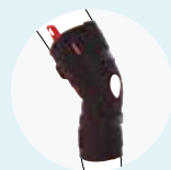
ゲニューディレクサ ステッブル (8353)