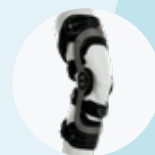
ゲニュー アレクサ (50K13)