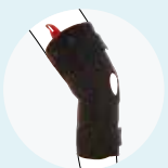
ゲニューディレクサ (8353)