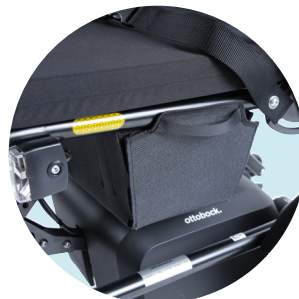
Sac de rangement