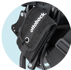
Pochette pour téléphone portable