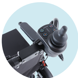
Support pour commande d'accompagnateur