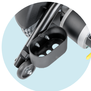
Porte-canne, en bas