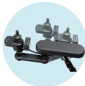
Support boîtier de commande escamotable, droit