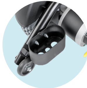
Porte-canne, en bas