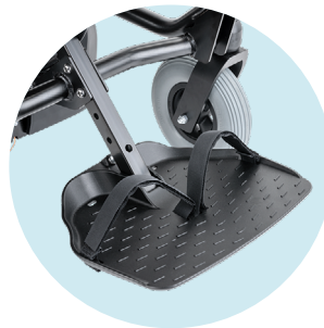
Sangle pour le positionnement des pieds