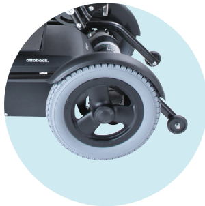
Spritzschutz für Antriebsräder inclus dans le modèle de base