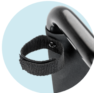
Porte-canne, en haute