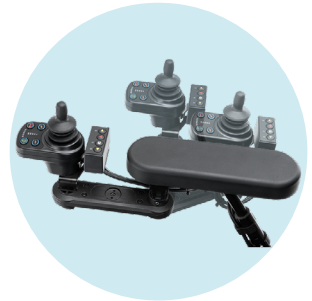
Support boîtier de commande escamotable, droit