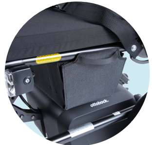
Sac de rangement