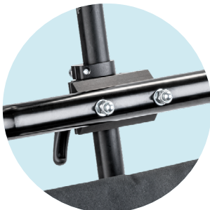
Accessoires de montage Harnais