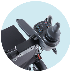
Support pour commande d'accompagnateur