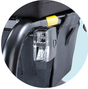
Beleuchtung für StVZO vorn