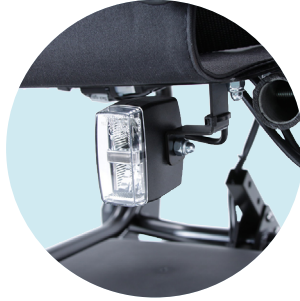
Beleuchtung für StVZO hinten