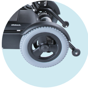
Spritzschutz für Antriebsräder im Grundmodell enthalten