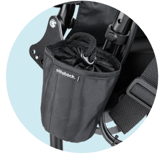
Halter für Getränke