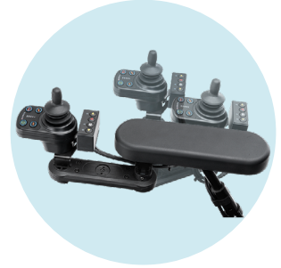
Parallel wegschwenkbarer Bedienpulthalter