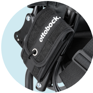
Tasche für Mobiltelefon