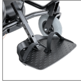
Sangle pour le positionnement des pieds