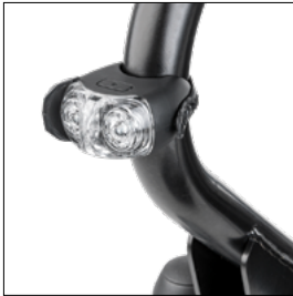
Éclairage, avant uniquement