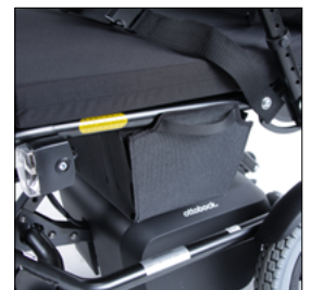
Sac de rangement