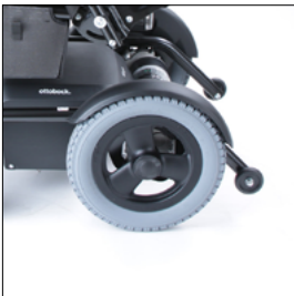
Garde-boue pour roues motrices