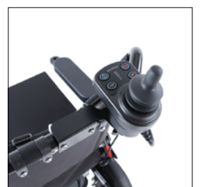
Support pour commande d'accompagnateur