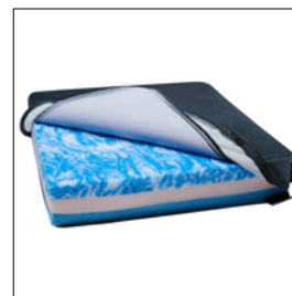
Coussin d'assise Evoflair