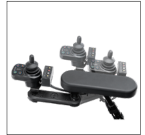
Support boîtier de commande escamotable