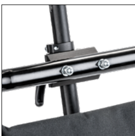
Adaptateur pour le kit de montage de l'appui-tête