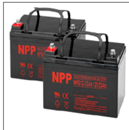
493U163=ST020 Batteries Gel (27 Ah (C5)/35 Ah (C20))