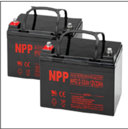
493U163=ST020 Batterie Gel (27 Ah (C5)/35 Ah (C20))