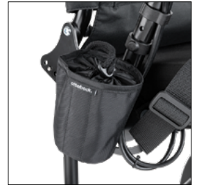
Halter für Getränke