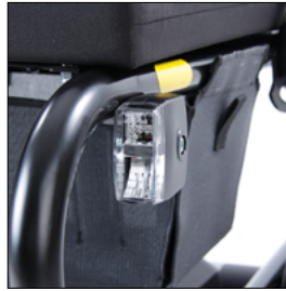
Beleuchtung für StVZO vorn/hinten