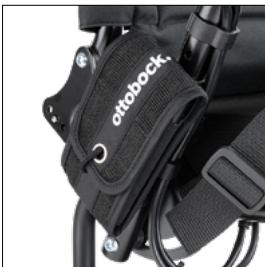
Tasche für Mobiltelefon