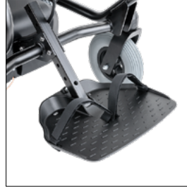
Positionierungsurte für Füße