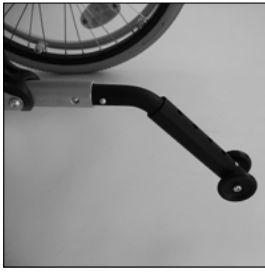
MA 103 Anti-bascule enfichable