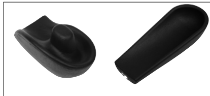
Positionnement des bras et des mains