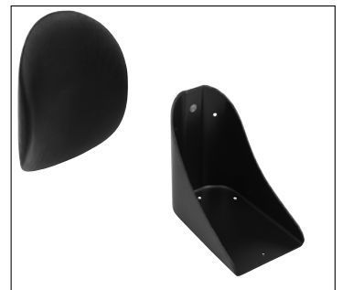
Positionnement des jambes et des pieds

Remarque : Vous trouverez d'autres accessoires tels que les appuis-tête, les supports thoraciques, etc. dans notre catalogue "Accessoires pour fauteuils roulants".