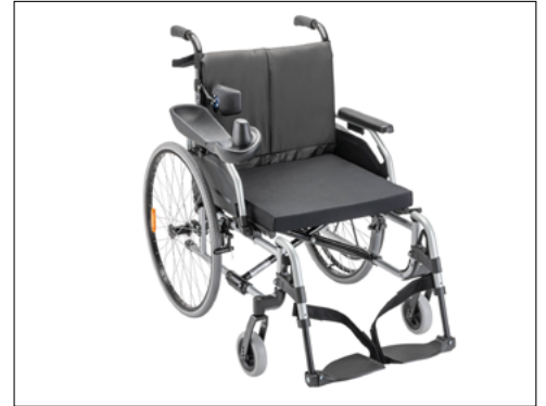
Illustration contient des accessoires