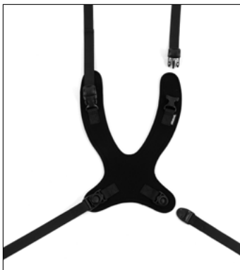
Positionnement du tronc