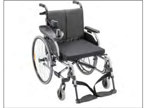
Abbildung enthält Zubehör