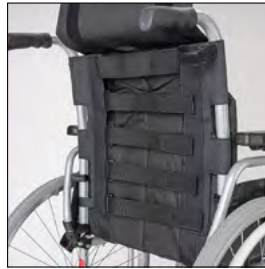
MD 19 Rückenbespannung Economy Ergo