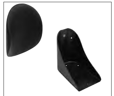
Bein- und Fusspositionierung

Hinweis: Weiteres Zubehör wie Kopfstützen, Seitenpelotten usw. finden Sie in unserem Katalog "Rollstuhl-Zubehör"