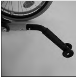
MA 103 Kippschutz steckbar