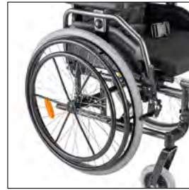
MG 83 Einhandbetrieb mit Doppelgreif- ringen