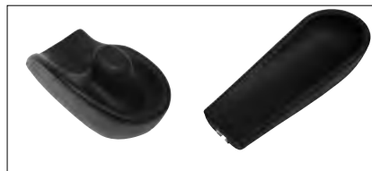
Arm- und Handpositionierung