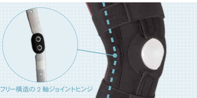
屈曲フリー構造の2軸ジョイントヒンジ