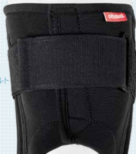
幅広伸縮 ストラップベルト