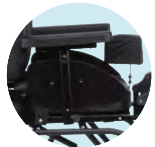
Seitenteil abnehmbar mit Armauflage (einstellbar)