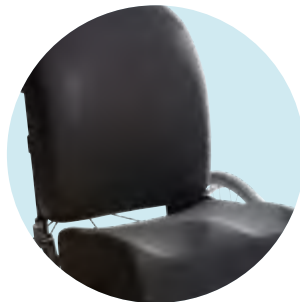
Konturiertes Rücken- und Sitzkissen