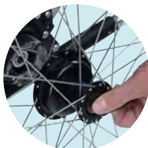
Schnellspannachse bei 24"-Antriebsrädern