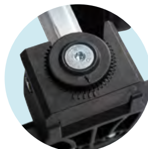
Winkelverstellung der Fußplatte