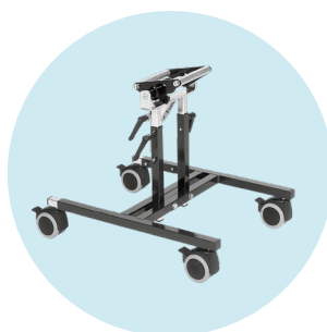
Kimba châssis interieur