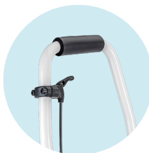
Barre de poussée avec levier de déclenchement pour le réglage de l'angle de l'assise