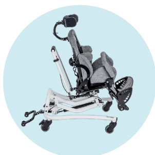
Réglage de la hauteur