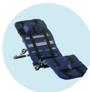
Robby lit de bain