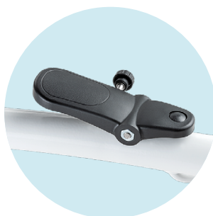
Pédale pour le réglage de la hauteur