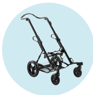
Kimba châssis routier