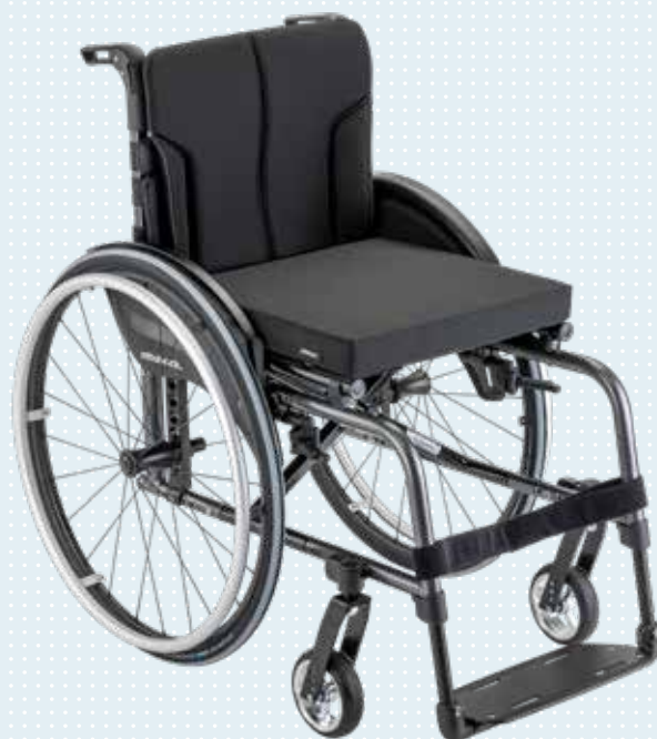
Motus 2 CS Der Sportliche Seite 16