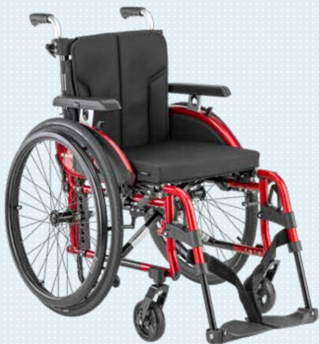
Motus 2 CV Der Variable Seite 12

Der neue Motus 2 wurde komplett überarbeitet und besticht mit Produkthighlights wie: Reduziertes Gewicht, neues Design, aktuellen Rahmenfarben und individuellen Ausstattungsoptionen. Alle Modelle lassen sich individuell einstellen. Für den Transport lassen sie sich schnell zusammenfalten.