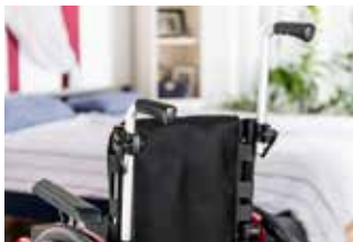
• Höhenverstellbare Schiebegriffe (optional)