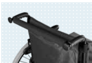
• Stabilisierungsstange (optional)