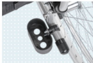
• Stockhalter (optional)