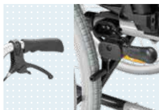
• Kniehebelbremse für Benutzer und Begleiter (optional)