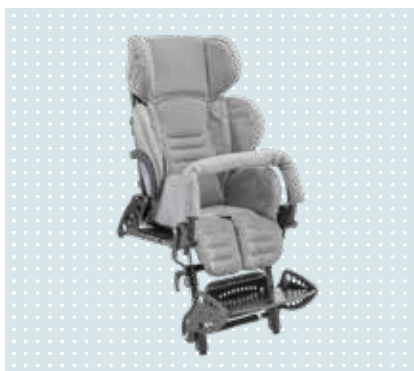
• Kimba ülésegség