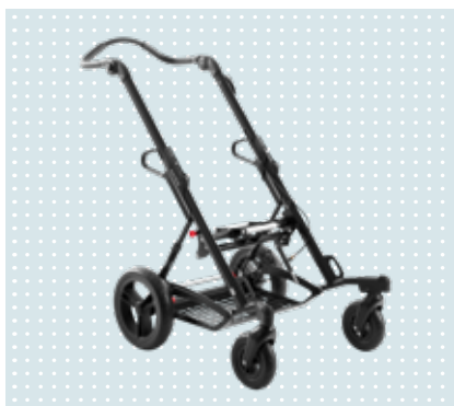
• Kimba kültéri váz