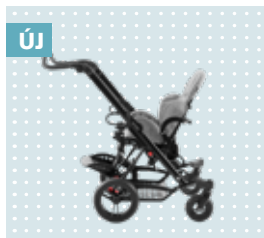
Új Egyszerűen megfordítható ülés egység.