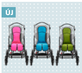
Új színek – egyedi és higiénikus betét