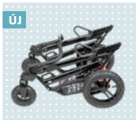
Új Könnyen összecsuható