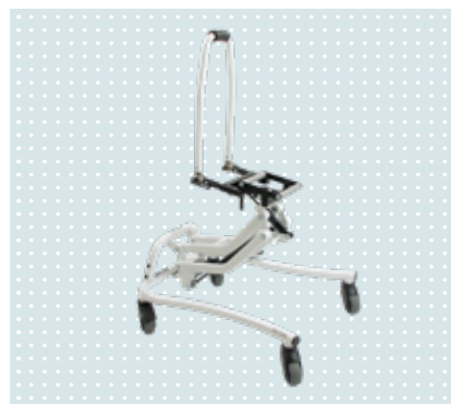
• Kimba szobai váz

A Kimba ülésegsége kombinálható bármilyen típusú vázzal. Alapkonfigurációban utcai vázra szerelve szolgáljuk ki, de rendelhető állítható magasságú szobai vázzal, cross vagy iker alvázal, de akár elektromos kerekesszék üléséként is.