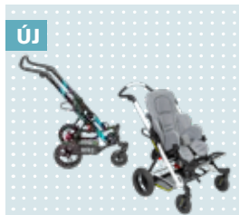
Új Fényvisszaverő matricák a betétekkel harmonizáló színekben.