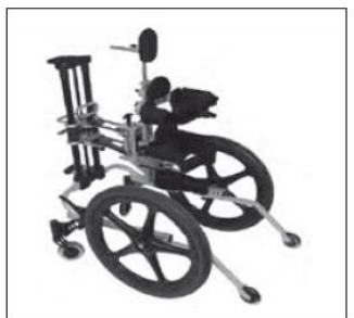
KidWalk z pelotami tułowia