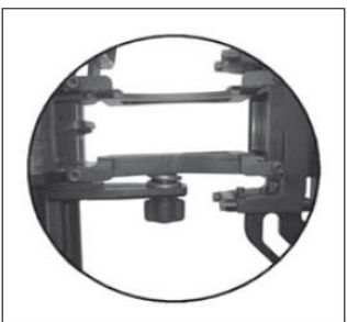
Regulowana sprężyna kompensująca obciążenie