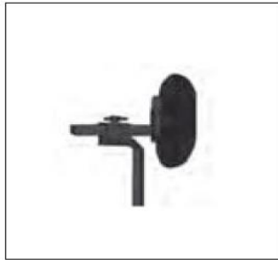
Zagłówek płaski, poduszka