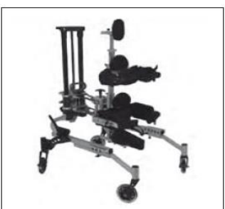
KidWalkw konfiguracji z kołami Cruiser