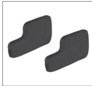
Wydłużone wyścielenie bioder