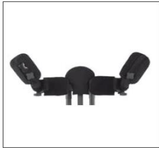
Odchylane peloty boczne