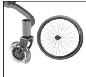
Koło Cruiser, Koła tylne