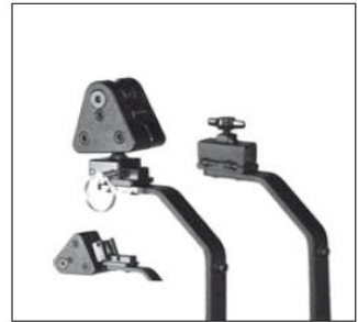
Mocowanie zagłówka i2i, odchylane