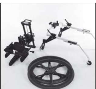
KidWalk rozłożony do transportu