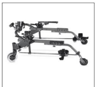
Przesuwne prowadnice dla stóp (mocowane do kostek)

Firma Otto Bock Polska zastrzega sobie możliwość dokonywania zmian w konfiguracji zamówienia w pełnym porozumieniu z zamawiającym na wypadek niemożności dostarczenia pierwotnej wersji konfiguracji.