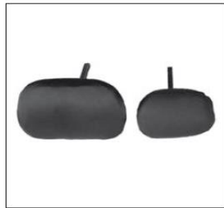
Zagłówki Contoured rozmiar S i M