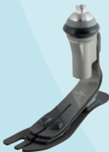
1C51 Taleo Vertical Shock