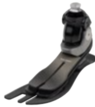
Taleo Adjust 1C56