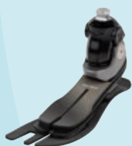
1C56 Taleo Adjust