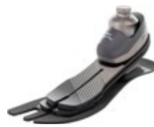
Taleo Side Flex 1C58