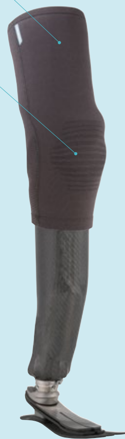
1C53 Taleo Low Profile