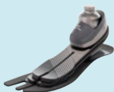
1C58 Taleo Side Flex