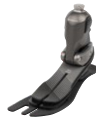
Taleo Adapt 1C59