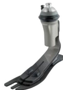
Taleo Harmony 1C52