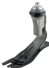
Taleo Vertical Shock 1C51