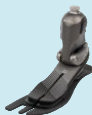
1C59 Taleo Adapt