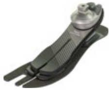
Taleo Low Profile 1C53