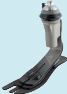
1C52 Taleo Harmony