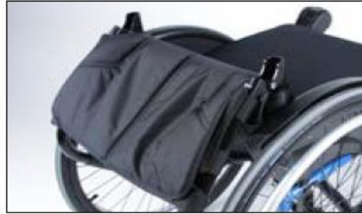
MD11 Foldable back support