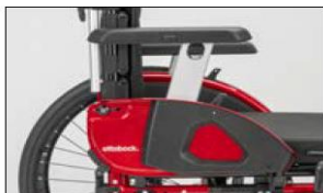
ME17 Side panel with arm support long, height-adjustable