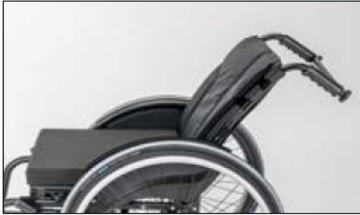
MD10 Back support, angle-adjustable