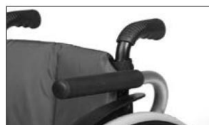
ME50 Side panel, padded