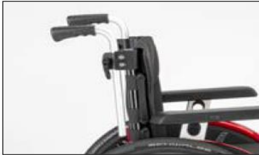
MD55 Push handles height-adjustable, removable