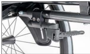
MH05 Outfront-scissor wheel lock