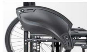
ME02 Side panel with clothing guard and against cold