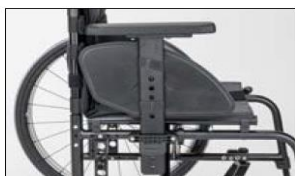
ME11 Plug-on side panel plastic