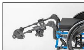
MB25 Leg supports, elevating

Firma Otto Bock Polska zastrzega sobie możliwość dokonywania zmian w konfiguracji zamówienia w pełnym porozumieniu z zamawiającym na wypadek niemożności dostarczenia pierwotnej wersji konfiguracji.