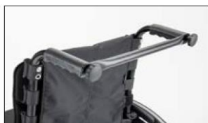
MD58 Stabiliser bar