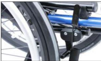
MH01 Knee lever wheel lock