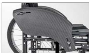
ME04 Carbon side panel