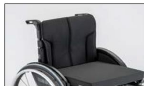
MD05 Back support upholstery, breathable