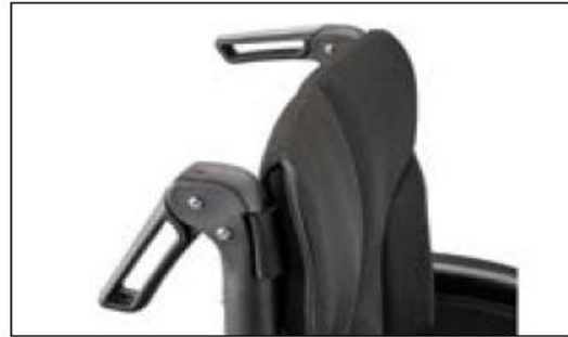
MD56 Push handles foldable