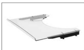
ME60 Therapy tray