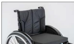
MD03 Back support upholstery, padded