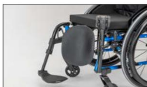
MB22 Amputation leg support, left