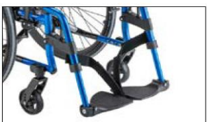
MB10 Leg support, individual, angle-adjustable, swivel up