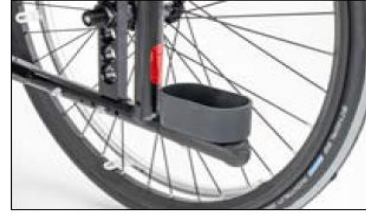
MA57 Crutch holder