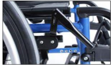
MH10 Knee lever wheel lock extension