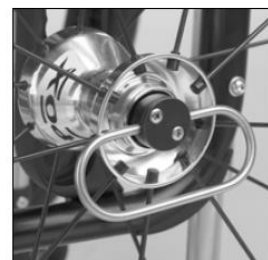
MG 28 Tetra release