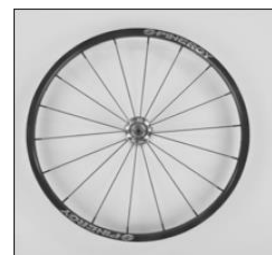
MG 10 Spinergy SPOX