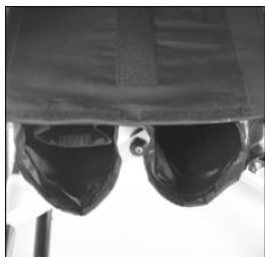
MC 15 Seat upholstery with storage compartments