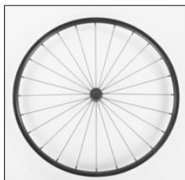
MG 15 Infinity Ultralight