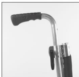
MD 55 Push handles, height-adjustable/ removable