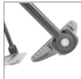
MB 27 Elevating leg support