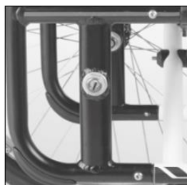
MA 114 Drive wheel adapter, permanently welded

Firma Otto Bock Polska zastrzega sobie możliwość dokonywania zmian w konfiguracji zamówienia w pełnym porozumieniu z zamawiającym na wypadek niemożności dostarczenia pierwotnej wersji konfiguracji.