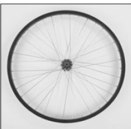
MG 06 Hollow rim