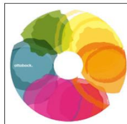
MG 104 Spectrum