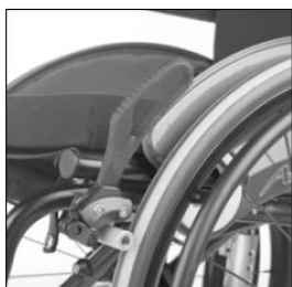
MH 10 Wheel lock lever extension