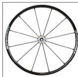
MG 11 Spinergy LX