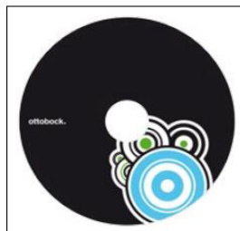
MG 100 Graphic