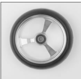
MF 35/36/37 4/5/6" soft caster