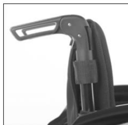
MD 56 Fold-down push handles