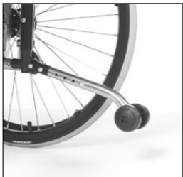
MA 55/56 Anti-tipper