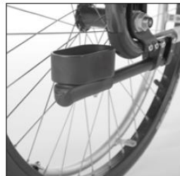
MA 57/58 Crutch holder