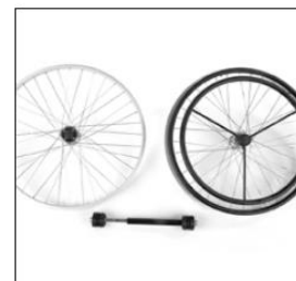
MG83 One-arm drive with double handrim