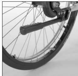
MA 51/52 Tip-assist