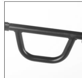
MB 120 Tube foot support