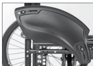
ME 02 アルミ製 クローシングプロテクター