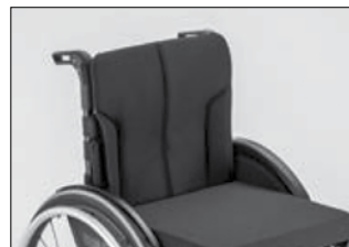
MD 05 バックサポートカバー 張り調整付き メッシュタイプ