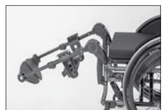
MB 25 エレベーター フットサポート