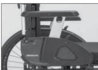
ME 17 アームサポート付 サイドパネル