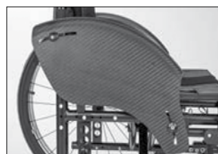
ME 04 カーボン製 クローシングプロテクター