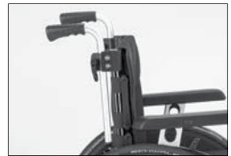
MD 55 プッシュハンドル後オフセット