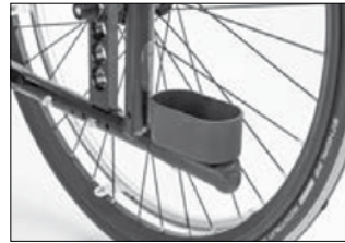
MA 57 杖入れ