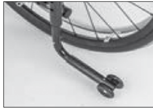
MA 55 転倒防止装置