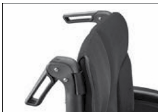
MD 56 プッシュハンドル フォールディング