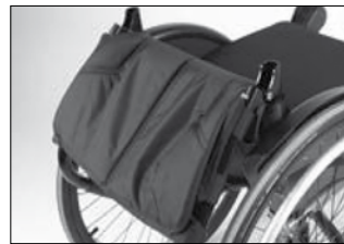
MD 11 バックサポート 背折れ機能付き