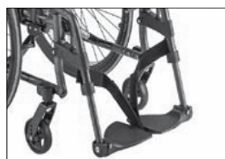
MB 10 2枚式フットサポート 着脱・スウィングイン/アウト