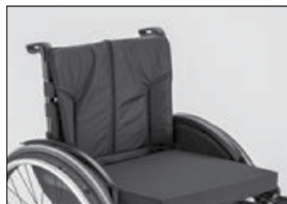
MD 03 バックサポートカバー 張り調整付き