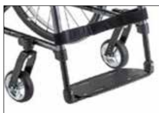
MB 03 1枚式フットサポート ※フットパネルの跳ね上げは可能