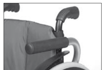
ME 50 パイプ式アームサポート