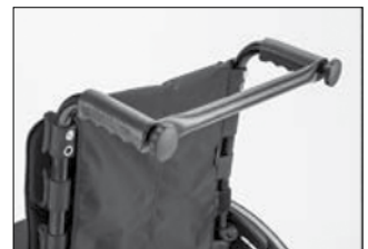
MD 58 スタビライザーバー