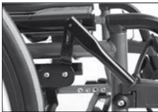
MH 10 ブレーキ延長レバー