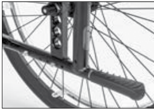
MA 51 ティップアシスト