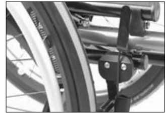
MH 01 標準ブレーキ 押しがけ