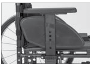
ME 11 プラグオン サイドパネル アームレスト付き