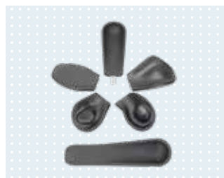
Arm- und Handunterstützung aus dem Zubehör-Programm