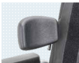
Seitliche Thoraxstütze aus dem Zubehör-Programm