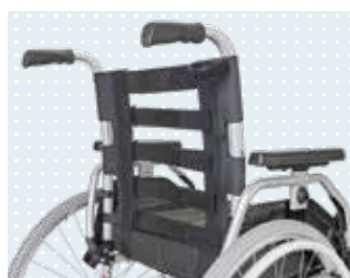
Economy Ergo Rückenbespannung