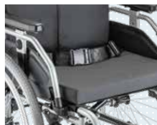
Beckengurt mit Verschluss