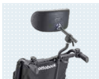
Kopfstützen aus dem Zubehör-Programm