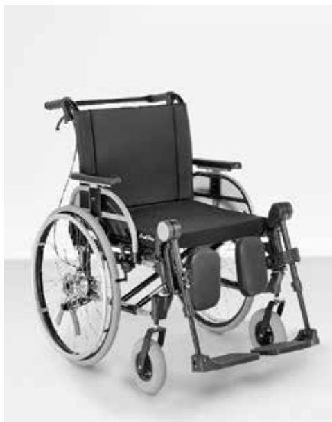
▶ Start M4 XXL – Das Modell für Sondergrößen Leichtgewichtsegment