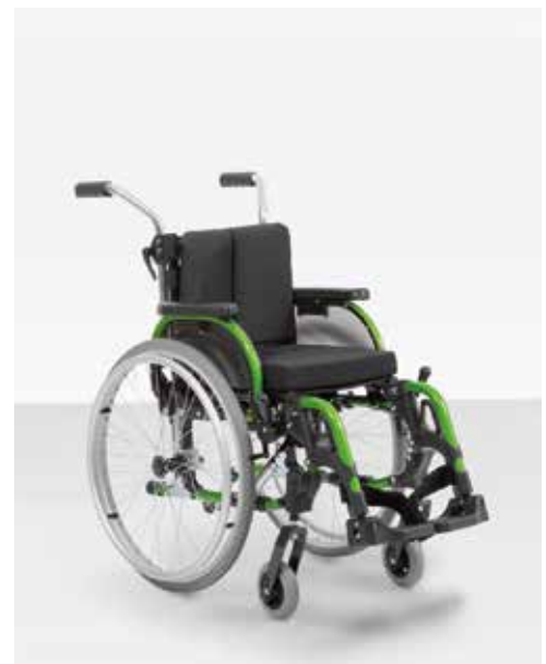
▶ Start M6 Junior – Das Kids Modell Leichtgewichtsegment