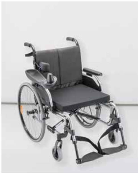
▶ Start 4 M2 Hemi – Das konfigurierbare Modell Leichtgewichtsegment mit Flex-Rahmen