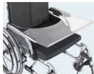
• Tablette thérapeutique