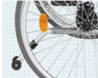
• Anti-bascule enfichable