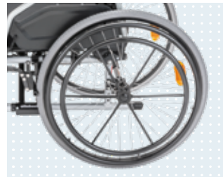
• Double main courante à commande unilatérale