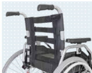
• Toile de dossier Economy Ergo