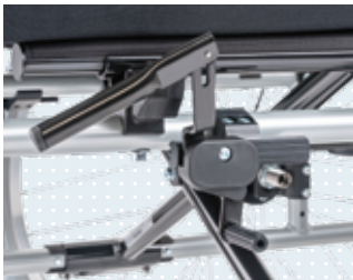
• Rallonge de levier de frein