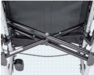
• Croisillon, 1,5 fois