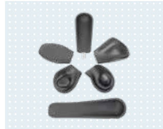
• Appuie-bras, disponibles dans la gamme d'accessoires