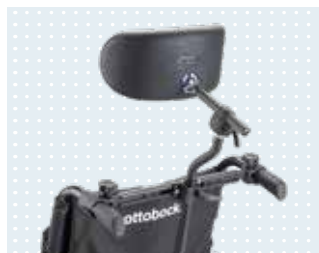
• Appuie-tête de la gamme d'accessoires