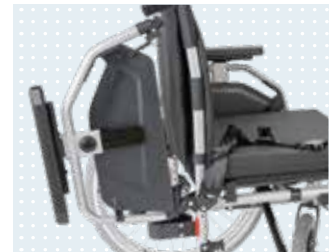
• Accoudoirs rélevable