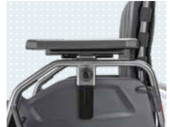
• Accoudoirs réglable en hauteur